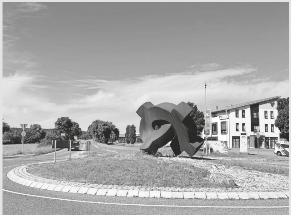
Vom Kreisverkehr bis zur Einmündung am so genannten „Schützen“ wird der Fahrbahnbelag der Landesstraße vollständig erneuert.

Es ist erfreulich, dass sich das Land Baden-Württemberg deutlich stärker als in den vergangenen Jahren für den Erhalt der Straßeninfrastruktur einsetzt. Als eine von drei Maßnahmen im Landkreis Tuttlingen wird auf einer Länge von gut einem Kilometer zwischen dem Kreisverkehr bei der Firma WWR und der Einmündung in die L277 auf der Umgehungsstraße die Fahrbahndecke vollständig erneuert. Die Bauzeit beträgt ca. fünf Wochen. In dieser Zeit ist eine Vollsperrung notwendig. Die Umleitung der Landesstraße 443 erfolgt für beide Richtungen über die Kreisstraße 5900 (Stetten). Das Baufenster wurde so gewählt, dass die Baustelle erst nach dem Southside-Festival eingerichtet wird und möglichst bis zum Einsetzen der Behelfsbrücke bei der SHW am 31. Juli abgeschlossen ist.